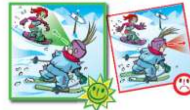
Rule 6: Stopping on the piste