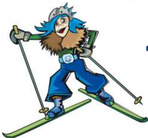
Джиб \ Jib