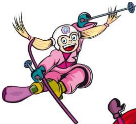
Пинти \ Pinty