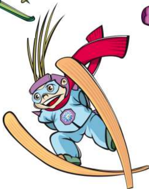
Слопи \ Slopy