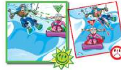
Rule 7: Climbing and descending on foot