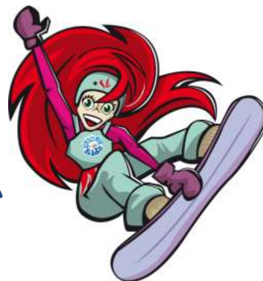
Мисти \ Misty